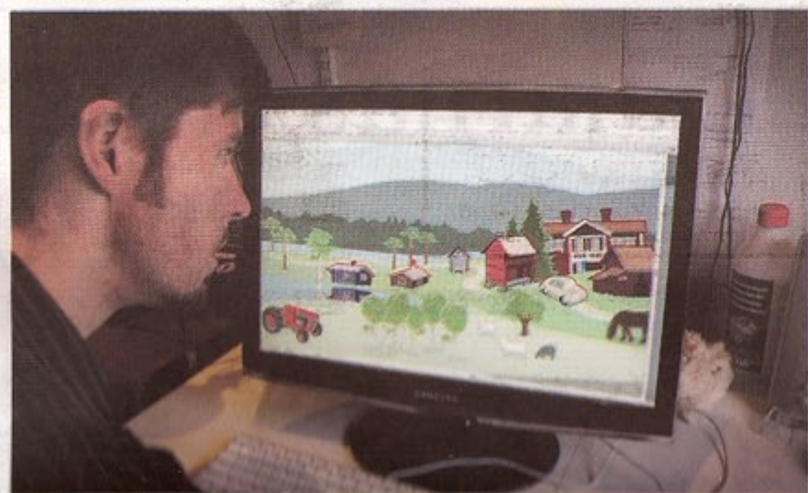
Mark har gjort en trevlig illustration över byn till dess hemsida.